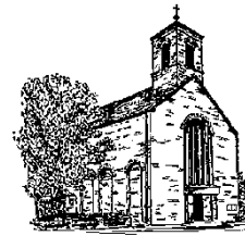
St. Michael, Emden