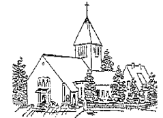
St. Walburga, Emden