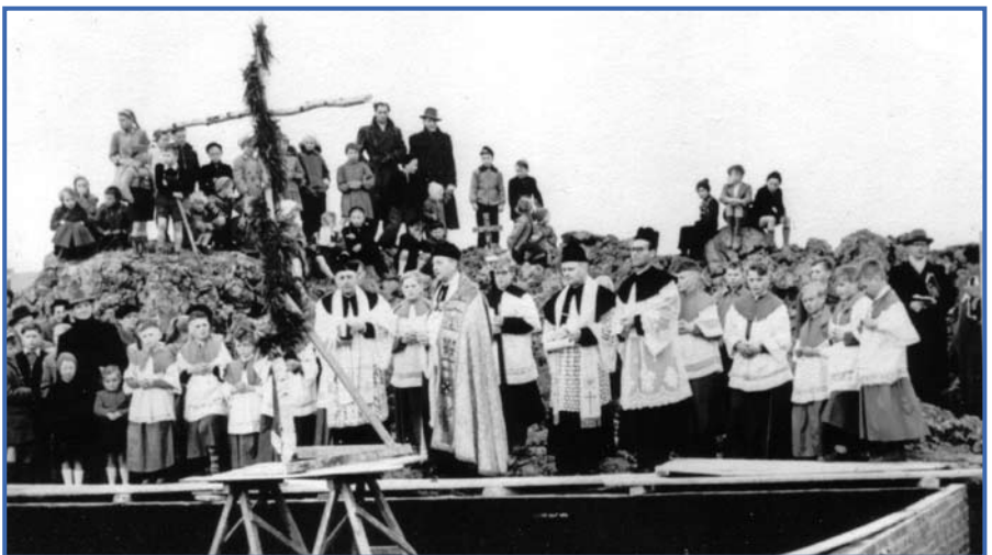
Weihe des Ortes, an dem der Altar errichtet werden soll. Diese Stelle wird durch das Holzkreuz gekennzeichnet.