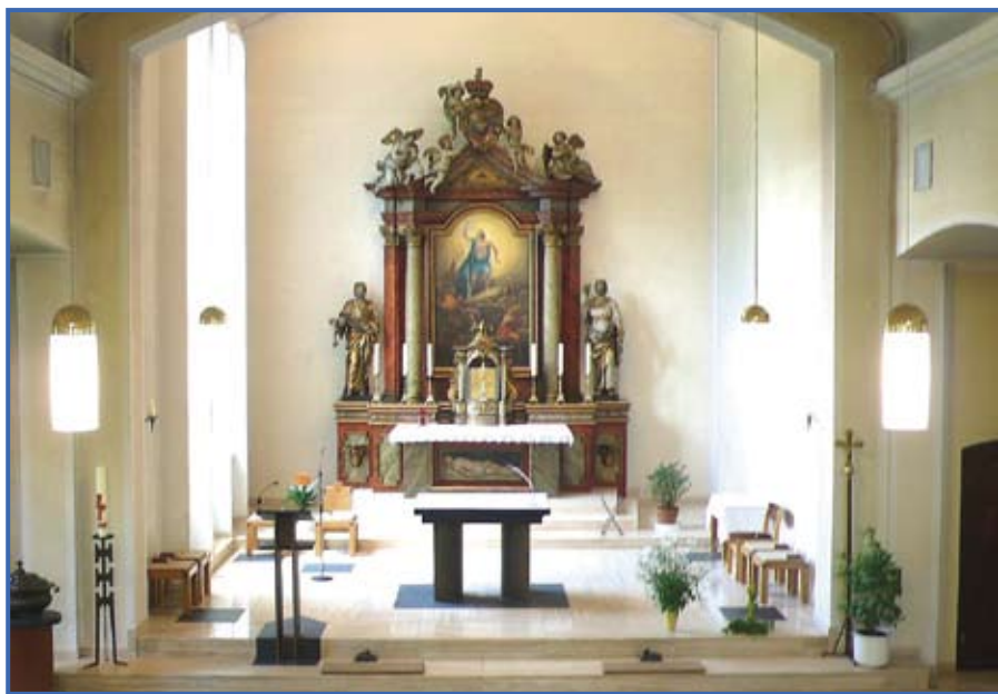
Barockaltar der Kirche St. Walburga, geschaffen 1749