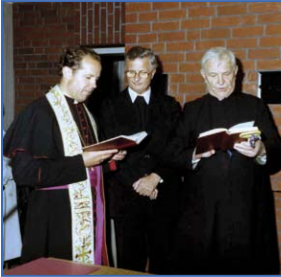
Weihbischof Theodor Kettmann