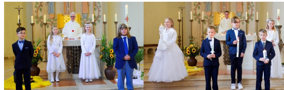
Erstkommunion Christ König Emden 2020