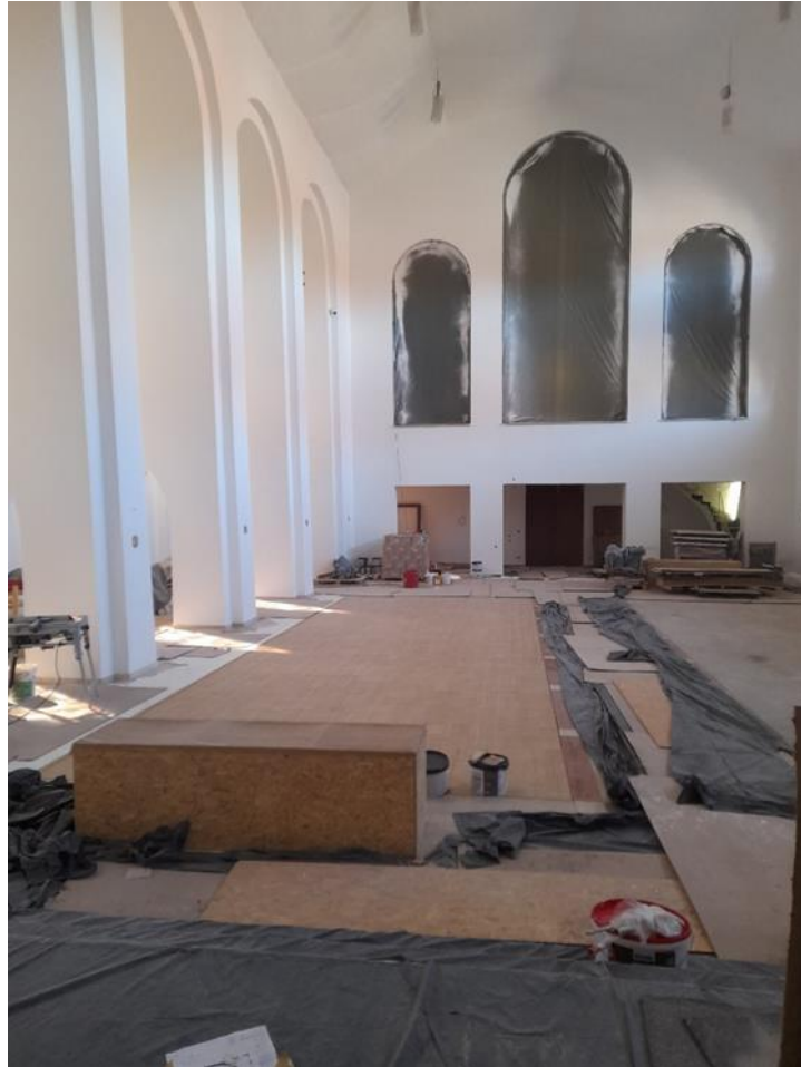
Das Parkett ist verlegt.