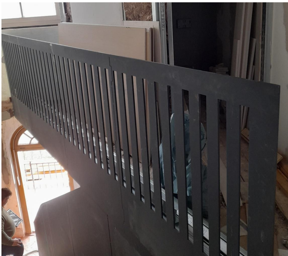
Das Treppengeländer zum Messdieneraum ist eingebaut.