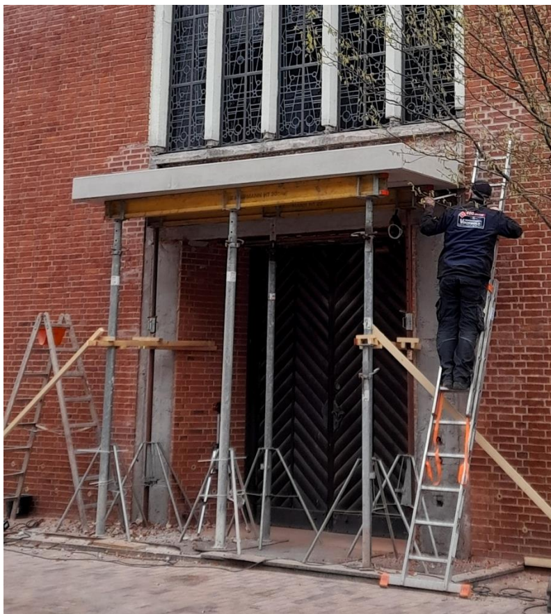
Die Außenarbeiten am Gebäude sind nahezu abgeschlossen.